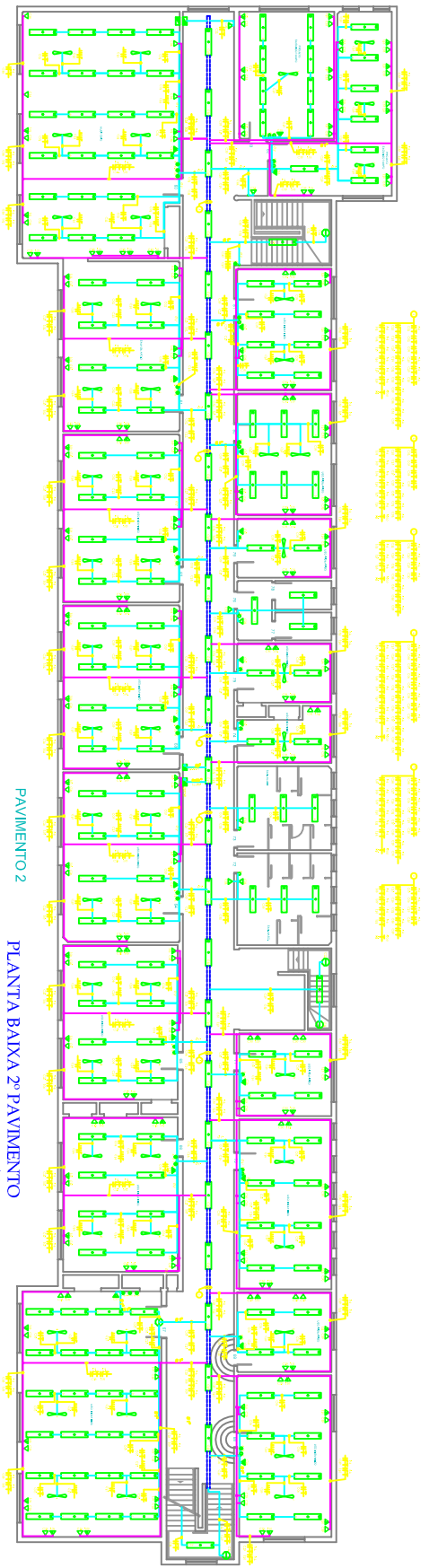
PAVIMENTO 2 PLANTA BAIXA 2º PAVIMENTO ESCALA 1/75